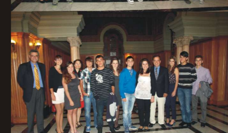
En esta ocasión asistieron a la puesta en escena de L'ELISIR d'AMORE dos grupos del IES Santiago Santana de Arucas acompañados de sus profesores.