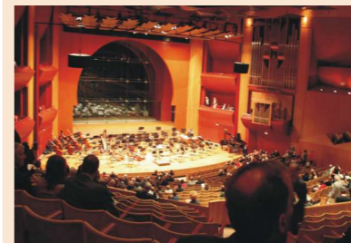
Sala Sinfónica. Auditorio Alfredo Kraus. Las Palmas de Gran Canaria