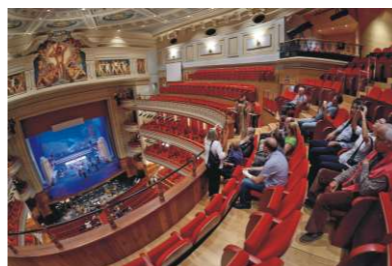
ACO se sumó al día internacional de la ópera en el Teatro Pérez Galdós.

El domingo 8 de mayo, con motivo de la celebración del Día Internacional de la Ópera, ACO respondió a la invitación cursada por la Fundación Teatro Pérez Galdós. Entre las 10h00 y las 14h00, el Teatro abrió sus puertas al público para acoger un servicio gratuito de visitas guiadas que permitieron no solo recorrer el coliseo sino admirar la obra de Néstor. Junto con las pinturas que embellecen la sala y el Salón Saint-Saëns, el numeroso público visitante pudo observar el montaje de L'Elisir d'Amore que ACO presentara en escena y a telón abierto, en particular el Acto II con las vistas al idílico Parador de Tejedá que el artista grancaño recrea. Durante la tarde, a las 19h30 daba comienzo la cuarta y última función de esta ópera poniendo broche final a un día muy especial para todos los amantes del género, que ACO y la Fundación Teatro Pérez Galdós celebraron al par de otros coliseos españoles.