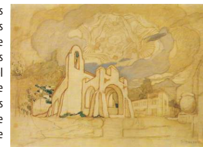
Néstor. Escenografía "Fiesta Pascual" (1937/1938).

El país sólo cuenta con dos ingresos básicos, el tomate y la banana, sujetos constantemente a la incertidumbre de reducción de contingentes, nuevos cultivos en competencia, vientos del sur destructores, falta lluvias que esterilizan y mezquinas ambiciones que aniquilan. En el periodo de grandeza (principal culpable de nuestra ruina) se tomó por normal e impercedero lo anormal de unos beneficios que enriquecían y ensoberbecían materializándolo todo y criminalmente destruyendo la única riqueza positiva: el espíritu.