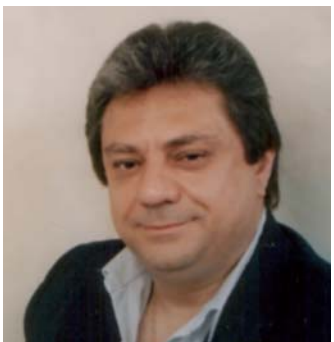
Pier Giorgio MORANDI